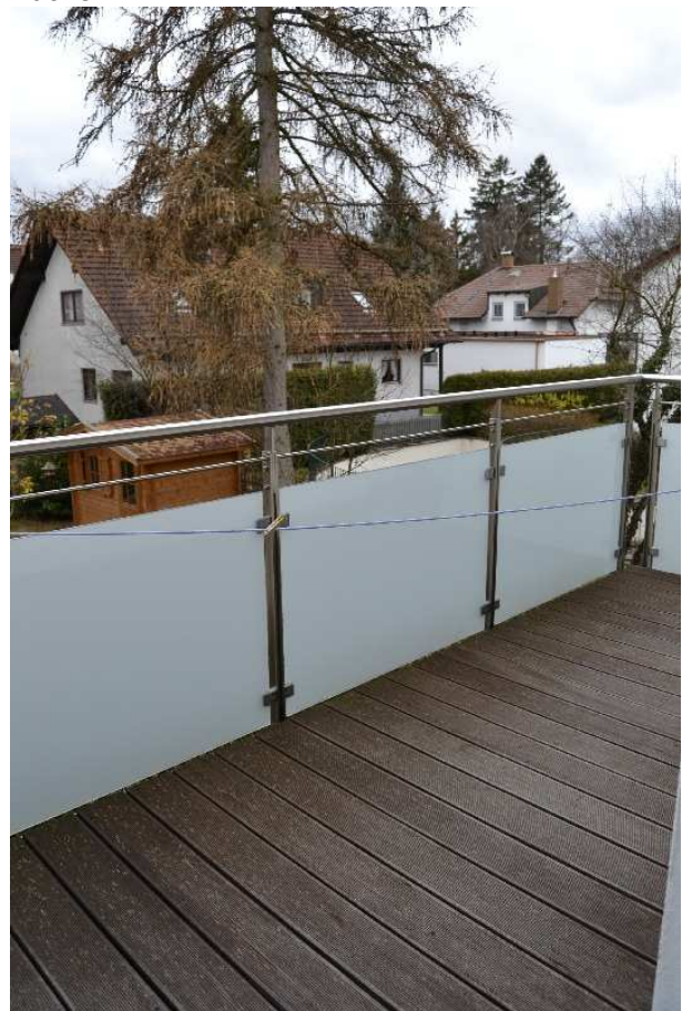
Blick vom 2. Balkon